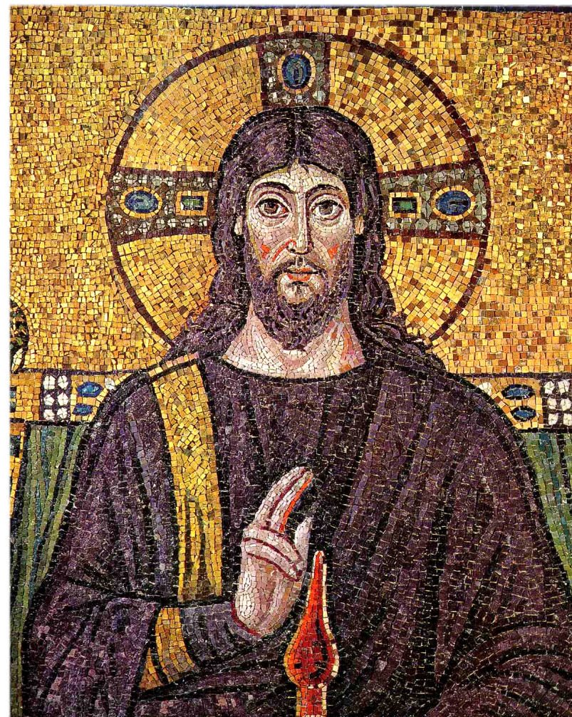
Christ surrounded by angels and saints AD526 mosaic Basilica of Sant'Apollinare Nuovo in Ravenna, Italy

yourchurch 25th Anniversary bulletin June 10th, 2018 Vol.25 No.23