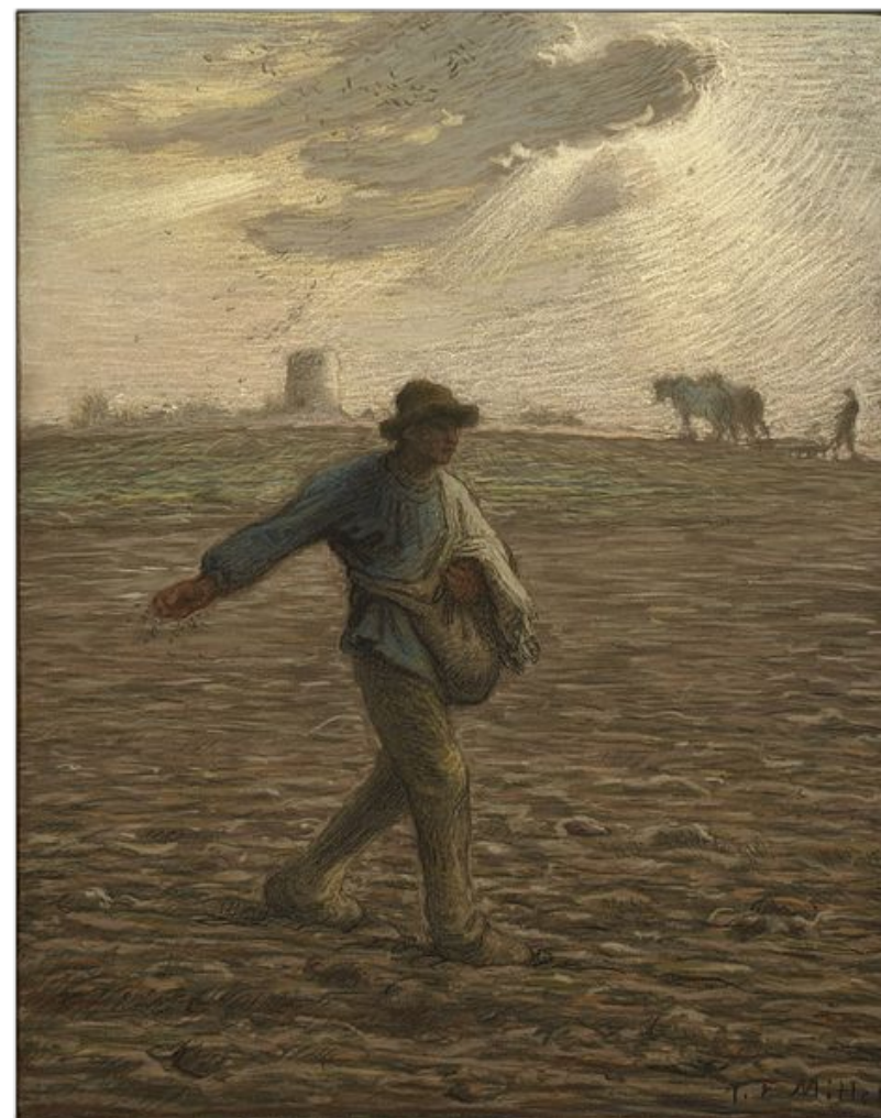
Le Semeur 1865-66 JEAN-FRANÇOIS MILLET Pastel and crayon on beige wove paper mounted on board Sterling and Francine Clark Art Institute, Williamstown, Mass