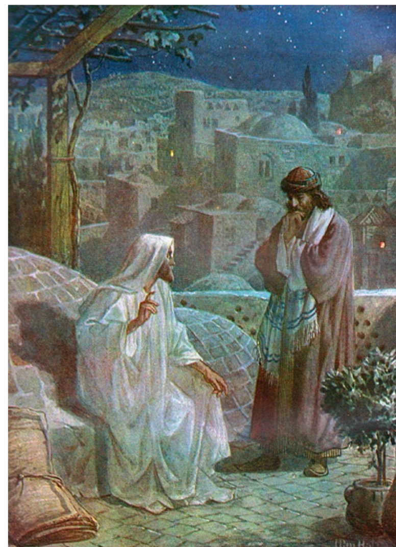
William Hole, Public domain, via Wikimedia Commons