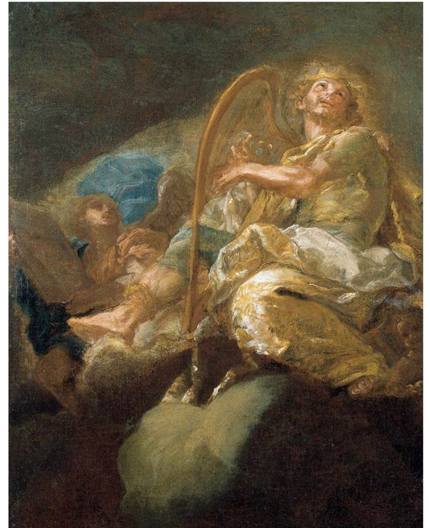
Giacomo del Pò, Public domain, via Wikimedia Commons