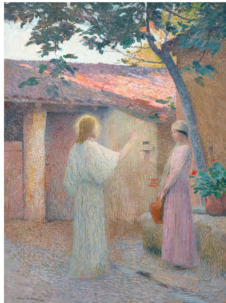
Henri-Jean Guillaume Martin